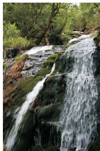
Fervezas do Teixido