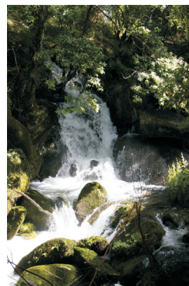
Fervezas do Sesín